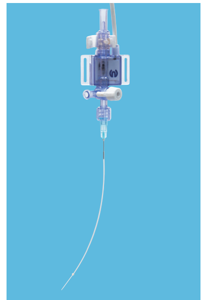
ディスポ血圧トランスジューサとの接続例